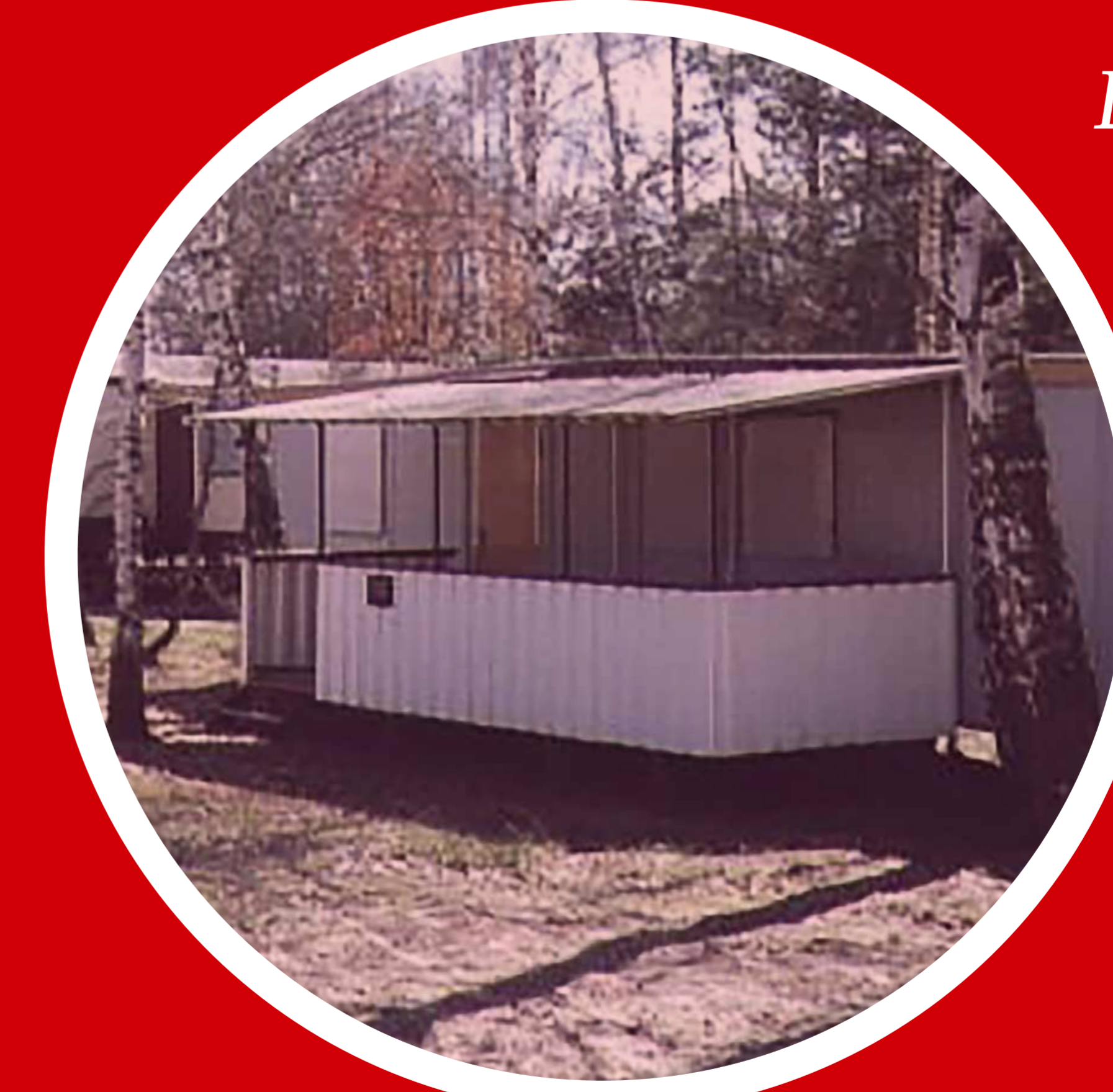
Bungalow in Parchau

Auch, aber nicht nur deswegen, wird die Stadtsparkasse zu einem der beliebtesten Arbeitgeber der Region.