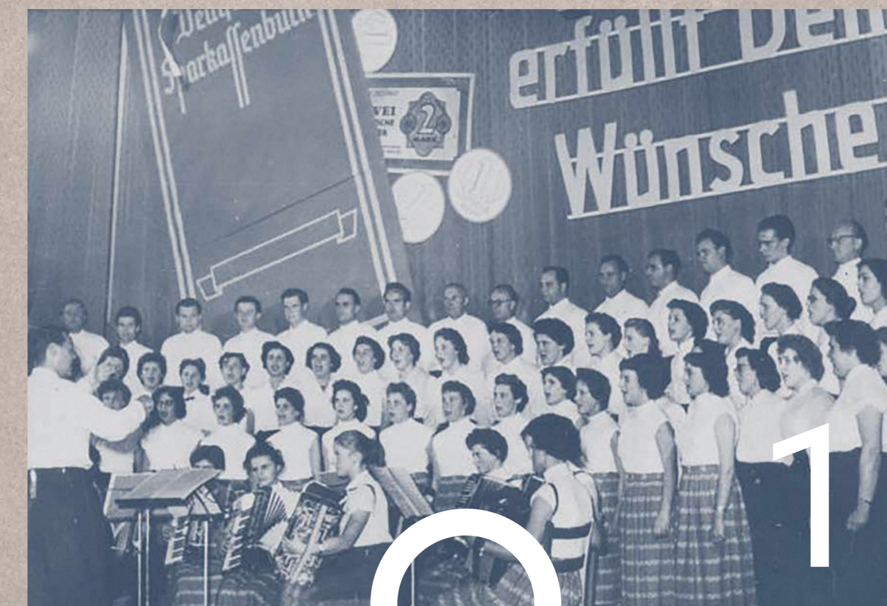
Chor der Stadtsparkasse Magdeburg bei der Sparwoche 1956