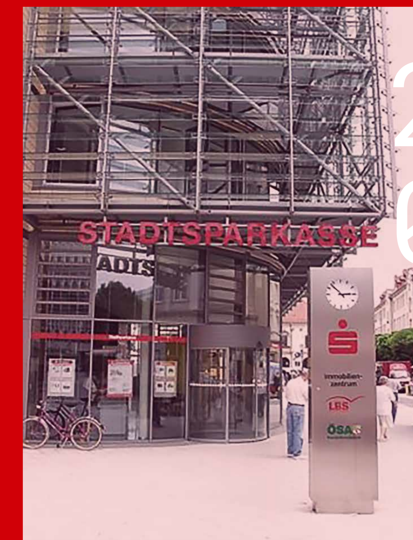
Hauptge- schäftsstelle Alter Markt