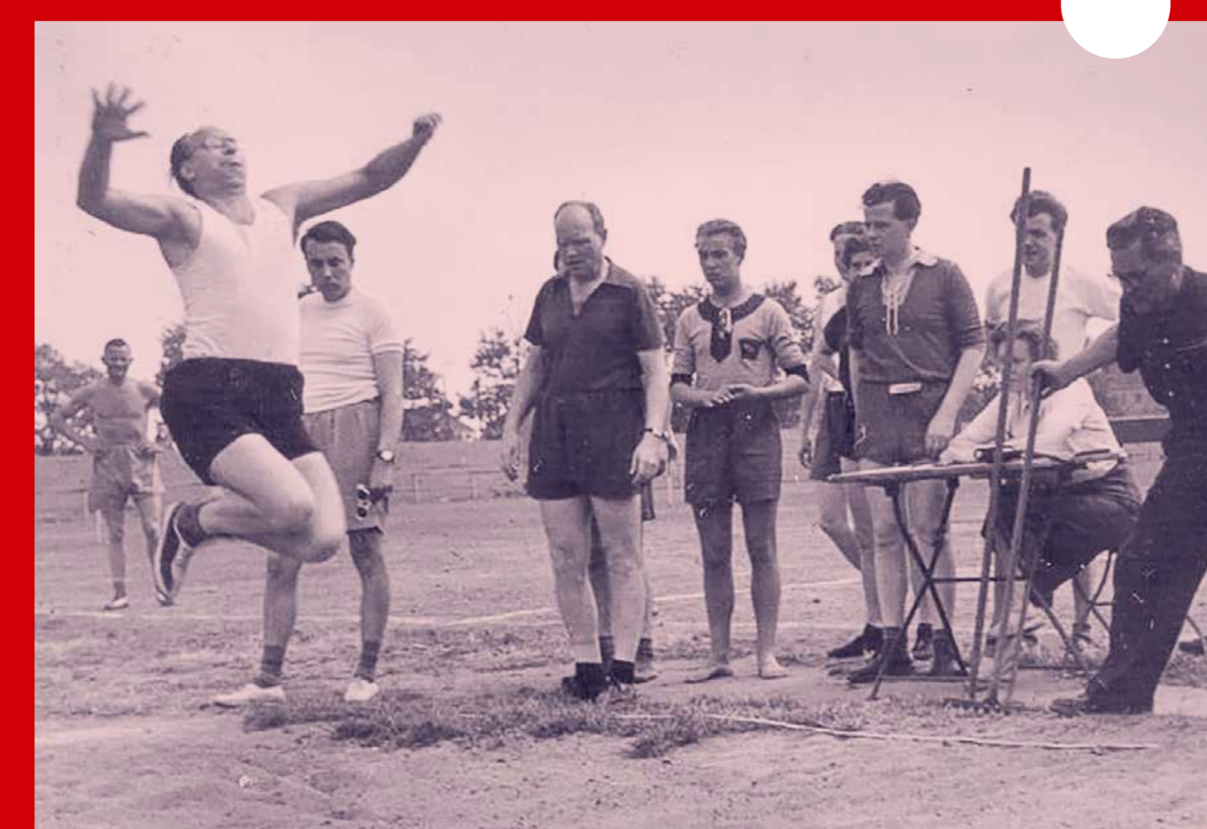
Bei den Sportfesten der Stadtsparkasse zeigen die Kolleginnen und Kollegen, was sonst noch in ihnen steckt

Die Altguthaben aus dem Krieg werden getilgt. Die fleißigen Mitarbeiter verschicken dazu 60.000 Benachrichtigungskarten an die Berechtigten. Als Ausgleich gibt es jetzt viele Sport- und Freizeitangebote, wie Sportgruppen und einen Chor.