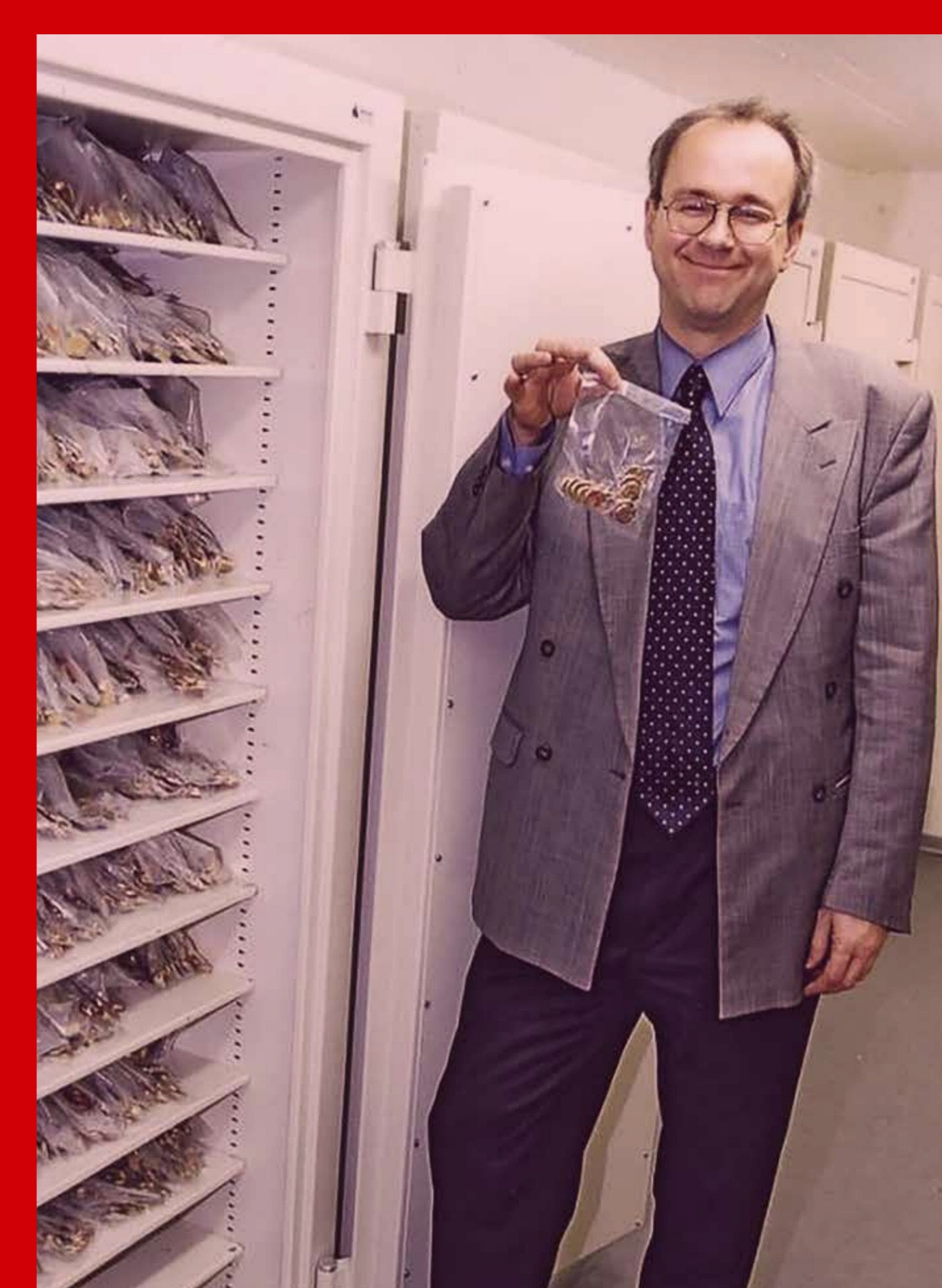
Die verpackten Starter-Kits werden abholbereit im Safe verstaut.