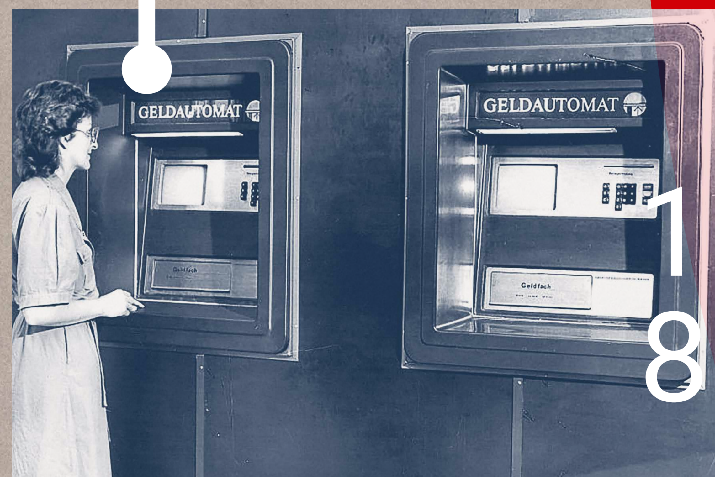
Geldautomaten in der Geschäftsstelle Große Münzstraße

Nach der Einführung der edv-Kontonummer kommt die Stadtsparkasse Magdeburg einem weiteren Wunsch ihrer Kunden und der Bürger der Stadt zuvor. Die ersten zwei Geldautomaten werden in der Geschäftsstelle „Große Münzstraße“ aufgestellt und vereinfachen den Magdeburgern das Geldabheben ungemein.