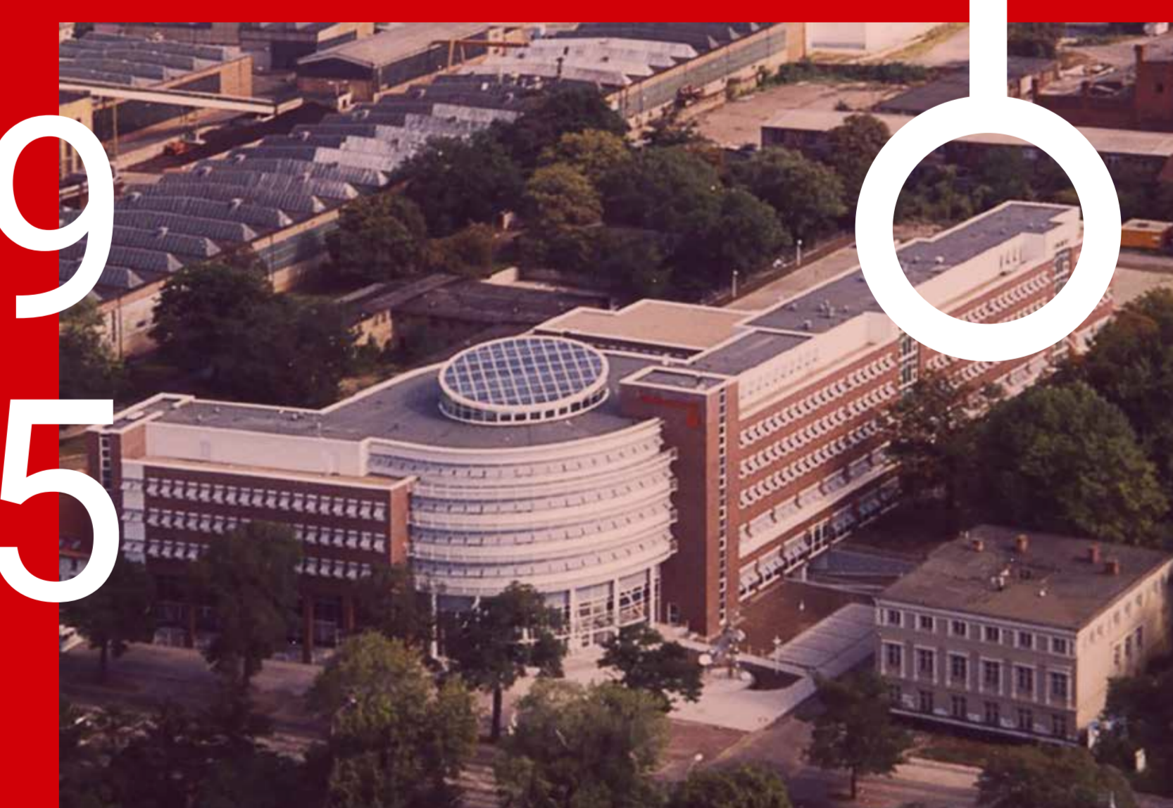
Hauptverwaltung Lübecker Straße

In der Großen Münzstraße geht 2001 eine Ära zu Ende: Die Stadtsparkasse Magdeburg zieht in ihre neue Hauptgeschäftsstelle Alter Markt - ein neues Gebäude im sehr dichten Geschäftsstellennetz.